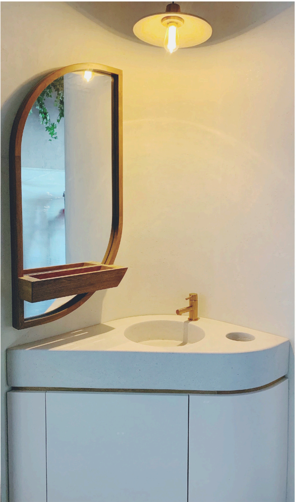
Lavamanos bajo diseño, estudio Volumaen Design.