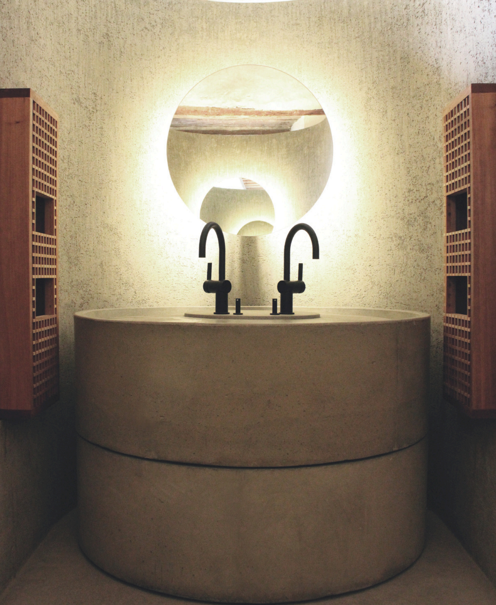
Lavamanos bajo diseño, estudio Macías Peredo